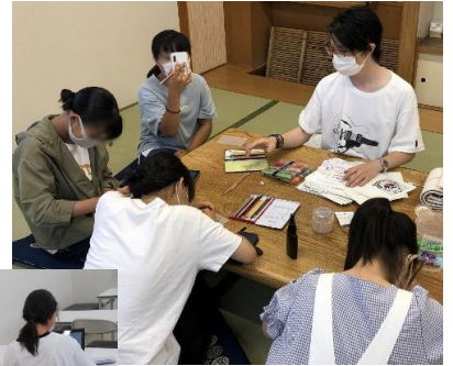
フリースペースの様子