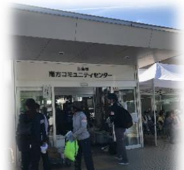
三原市災害 VC がある 南方コミュニティセンター